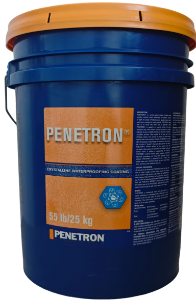
美国澎内传®防水涂料产品包装