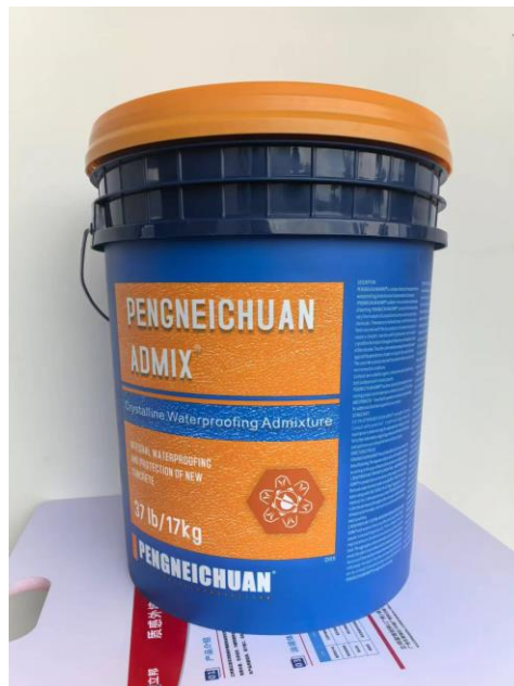
假冒澎内传防水添加剂产品包装