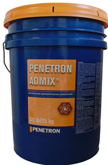
美国澎内传®防水添加剂产品包装

其中之一是广州顶新防水科技有限公司宣传的贴有汉语拼音“pengneichuan”“pengneichuanadmix”商标的水泥基渗透结晶型防水材料，在中国市场和网络上公然仿冒“PENETRON®澎内传®”品牌、包装、规格型号，发布“pengneichuan”商标的照片、视频等进行虚假误导性宣传；采用自编、盗版、造假的检验报告、代理授权、宣传文件、PPT 资料等冒充美国 PENETRON® 澎内传® 产品进行欺骗性销售。